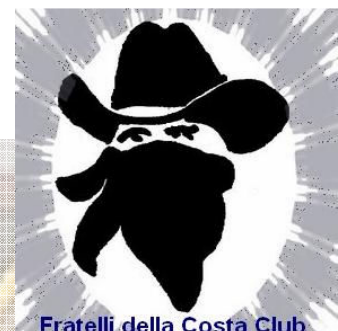
Fratelli della Costa Club